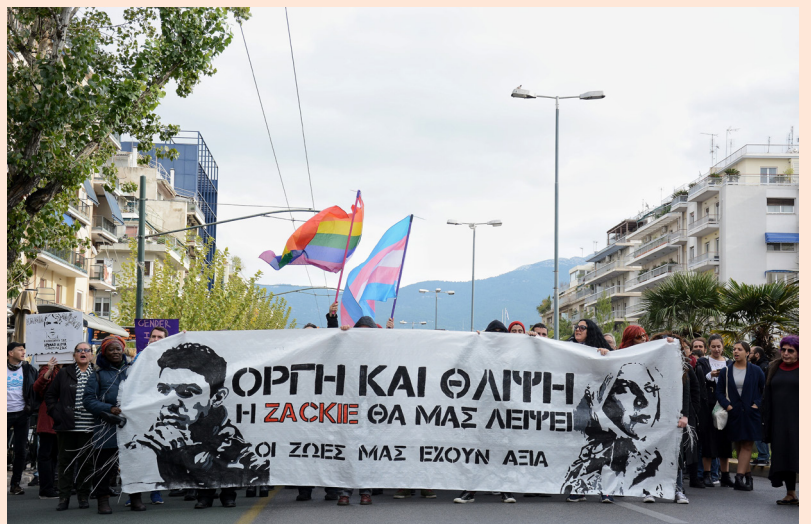
聲援追討柴克正義的遊行隊伍