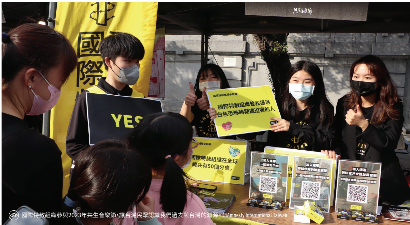
國際特赦組織參與2023年共生音樂節，讓台灣民眾認識我們過去與台灣的淵源。

2023年開始，我們迎來許多的好消息，首先要感謝的就是行動者們過往與我們一起的付出與努力。為了讓行動者們未來能夠繼續和我們前進，培力和增能是不可或缺的重要元素。因此，在2023年的上半年，我們規劃不同類型、不同議題的行動者培訓，包含加強行動者連結、行動事前培訓、實際行動參與、議題讀書會、議題講座等內容。同時，2023年嘗試串聯南部關注性別議題的人權團體，共同舉辦「南方性別點點名」系列活動，從3月到6月，從講座、世界咖啡館到電影放映，從女性、LGBTQ、跨性別，到原住民族的性別議題，以及兒童青少年對自我的性別與情感認識。期待透過多元的呈現方式，讓關注性別議題的南部人權行動者們，有更多互動與增能的機會。